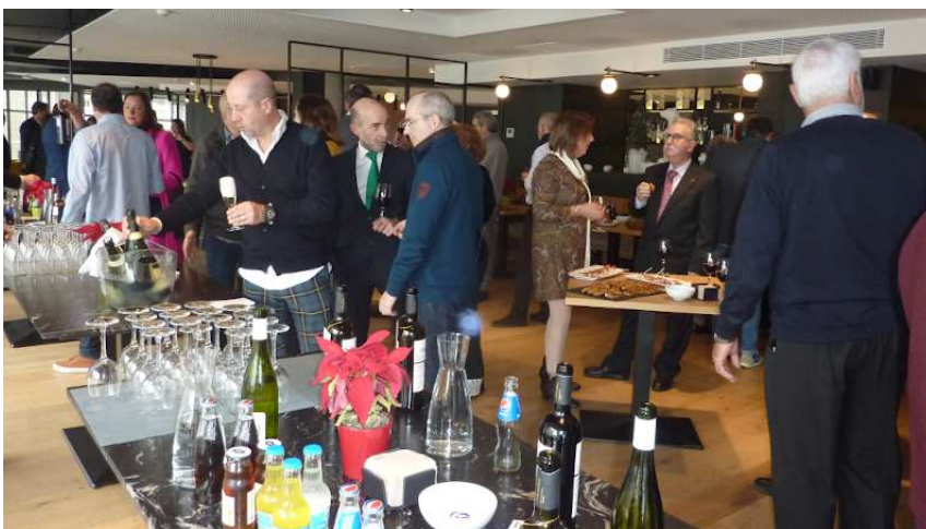
Diciembre 2019: El día 13 se celebra el Día del Agente Comercial en el Hotel Riazor, con imposición de insignias a los colegiados que cumplen 25 años en la colegiación.